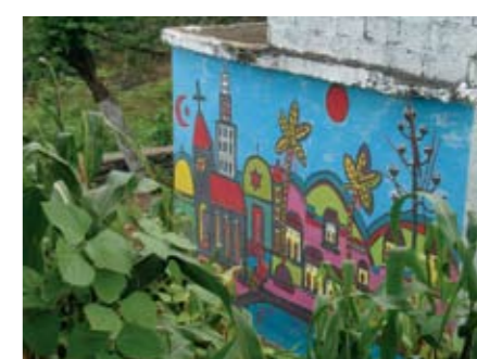
Rehabilitation, créations et activités culturelles au village de Porto Madeira. Île de Santiago. Cap-Vert

Idee originale et Creation des parapluies : Misa (Cap-Vert). Creation graphique : Agnes Cherbonnel (France)